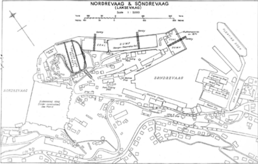
Tegning over Laksevågneset oktober 1944. Bristisk etterretning. DKV's arkiv, Statsarkivet i Bergen.

kunne være sann. Så dårlig var nok ikke engelskmennene uti faget geografi. Eller?