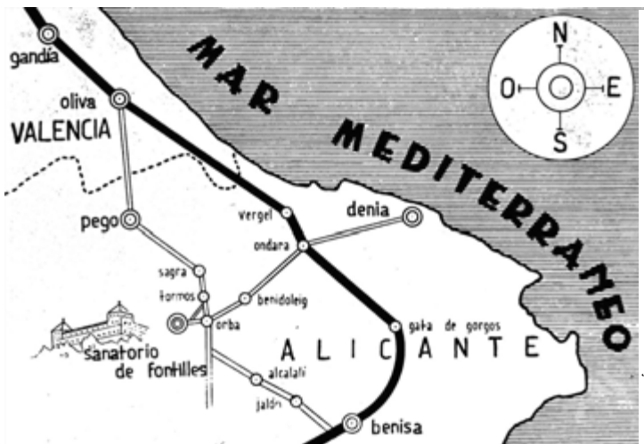
Sanatorio de Fontilles Beliggenhet: østkysten av Spania, ca. 20 km fra Denia og ca 90 km både fra Valencia og Alicante.

dog rikt, for det hadde en egen, ny grunnlov. Det var i ferd med å utvikle seg til et modell-samfunn der de forskjellige institusjoner fungerte som en levende organisme som kunne lignede med et velsmurt lokomotiv som drog folket mot uavhengighet.