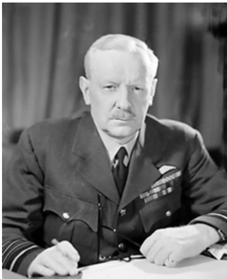
Marshal of the Royal Air Force Arthur Travers Harris (1892-1984)

31. mai 1992, på 50-årsdagen for det store flyangrepet mot Köln, ble en statue av Arthur Harris avduket i London av den britiske dronningmoren, og med forhen- værende statsminister Margaret Thatcher blant de prominente og begeistrede gjestene.