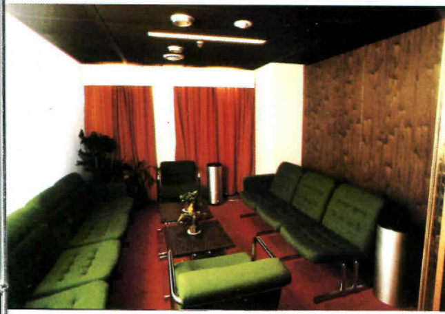
2. Statfjord A-plattformen vil være klar for produksjon i 1979.