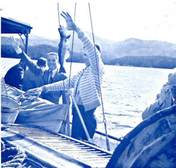
Dagens første fisk vises stolt frem.

Men allting har en ende, så også dette vellykkete bordsete. Dagene er korte i september og vi skal ha mest mulig med. Oppbrudd fra Godøysund — ferden går videre. Hva nå? — «Diva» pløyer gjennom Bård-sund — ut på Selbjørnsfjorden — litt slingeras, og så dreier vi opp Bekjarviksundet. I det fjerne skimter vi Kolbeinsvik og så ser vi MOBIL-merket lyse oss i møte fra tankanlegget der. Det kan da vel aldri være meningen at hele dette kobelet skal