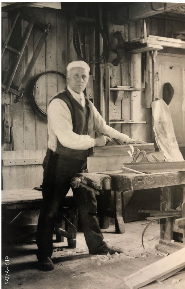
Illustrasjonsfoto: Fange i snekkerverksted ved Trondheim landsfengsel.