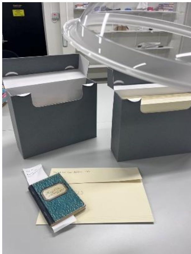
Arkivet er tatt inn i behandlingsrom i Normoria og vert gjennomgått førbehandling i varmekammer og plassering i magasin.

Den 27.januar 2026 kom arkivet på plass hos Nordmørmusea i Kristiansund