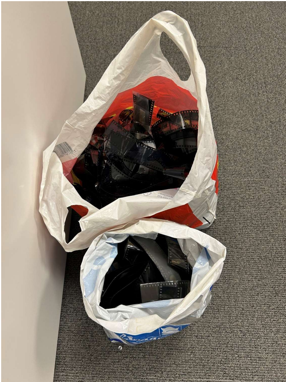
Mye av materialet lå helt løst, enten rett i eskene eller i plastposer slik som på dette bildet.