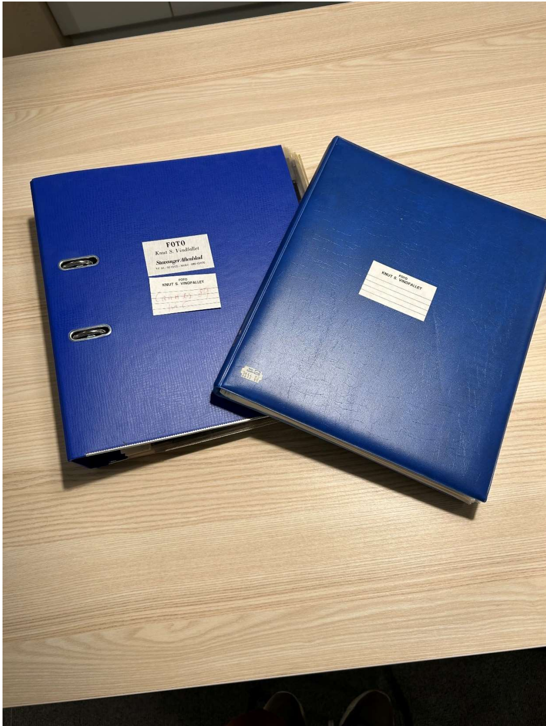
Deler av materialet befant seg ellers i permer, merkede og umerkede