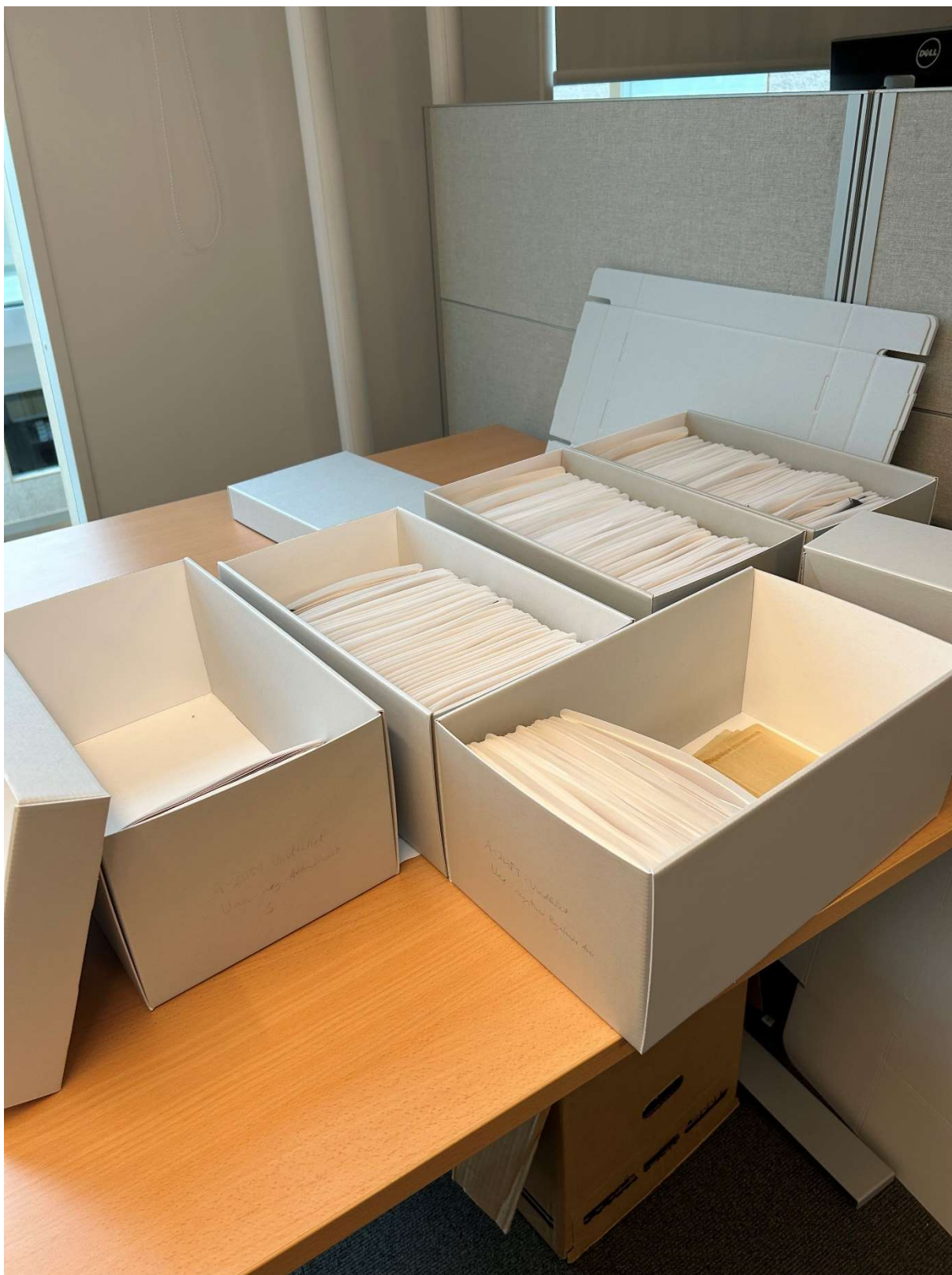
De ferdig pakke konvoluttene ble sortert i henhold til underserie og lagt i esker...