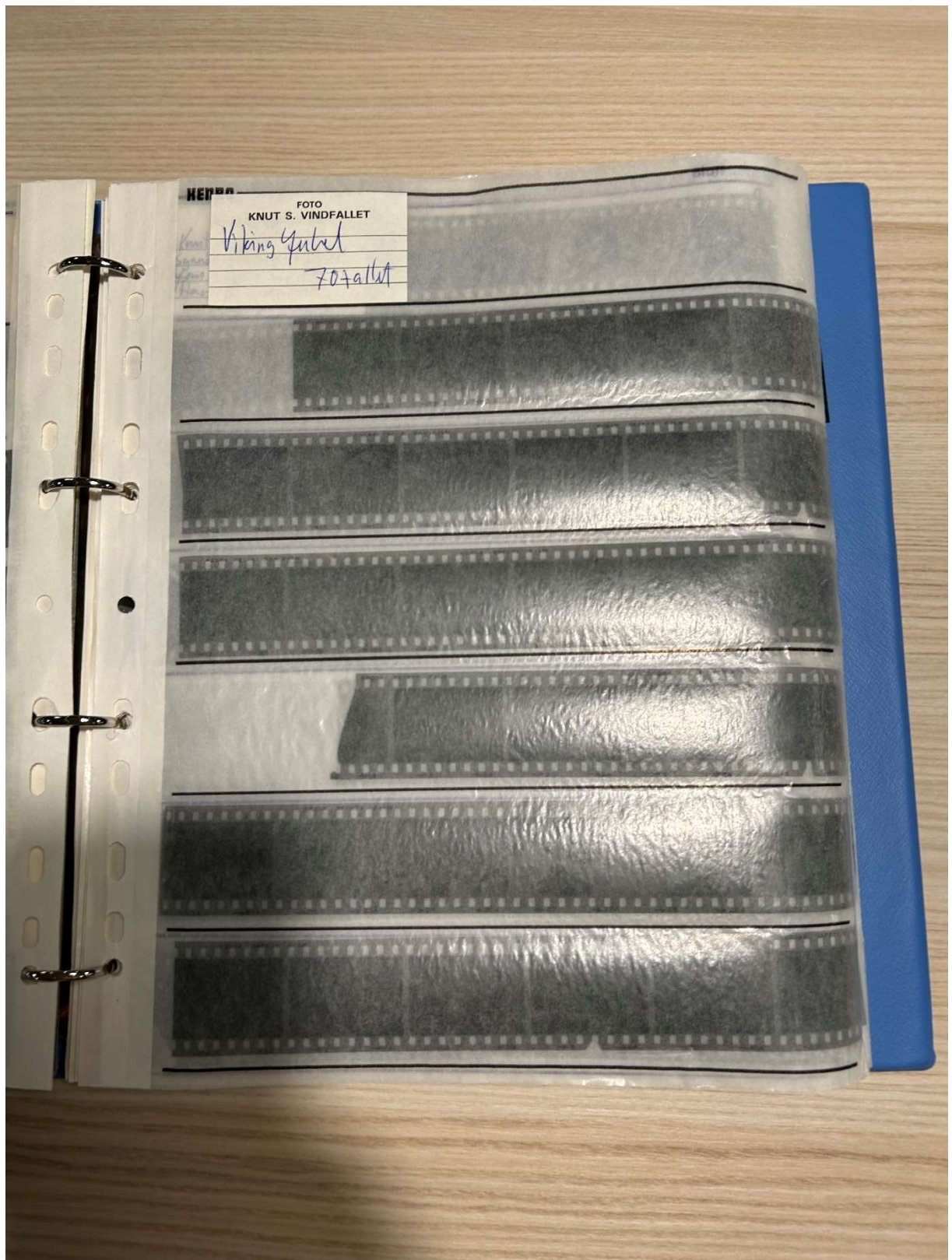
Innholdet i permene var noen ganger merket...