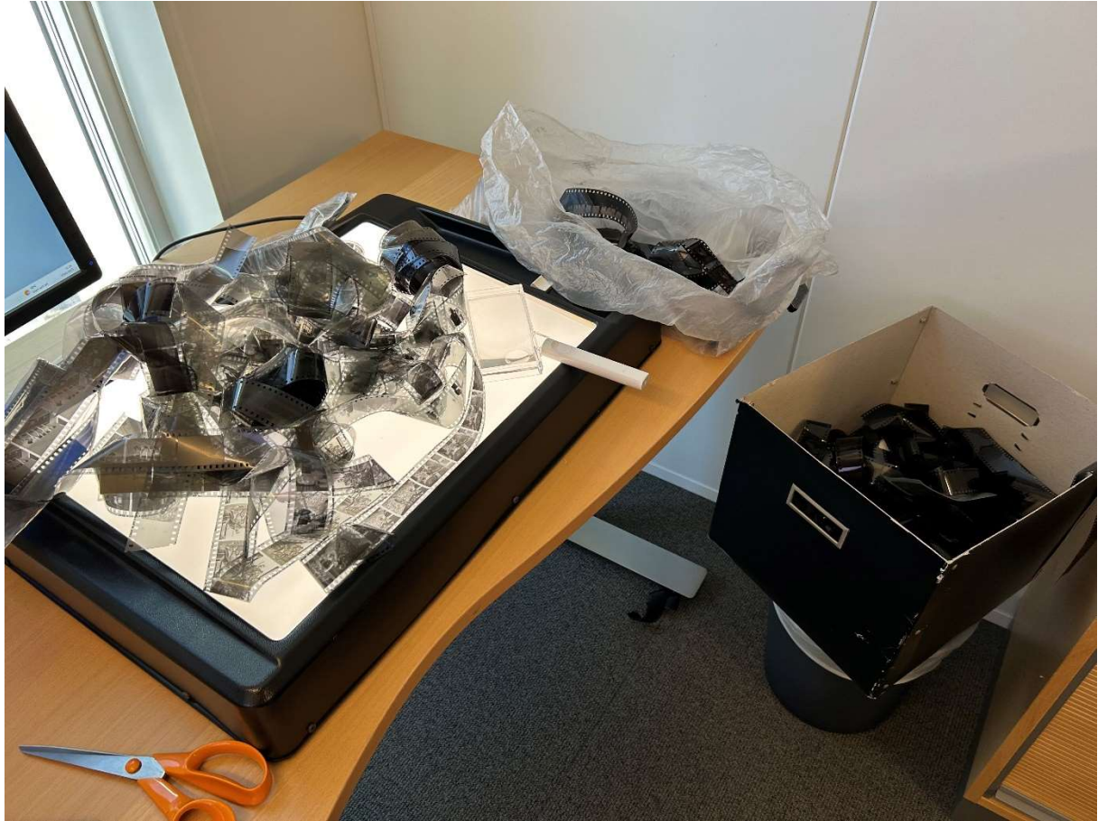
Mye rot i det avleverte materialet gjorde ordningsarbeidet ekstra tidkrevende.