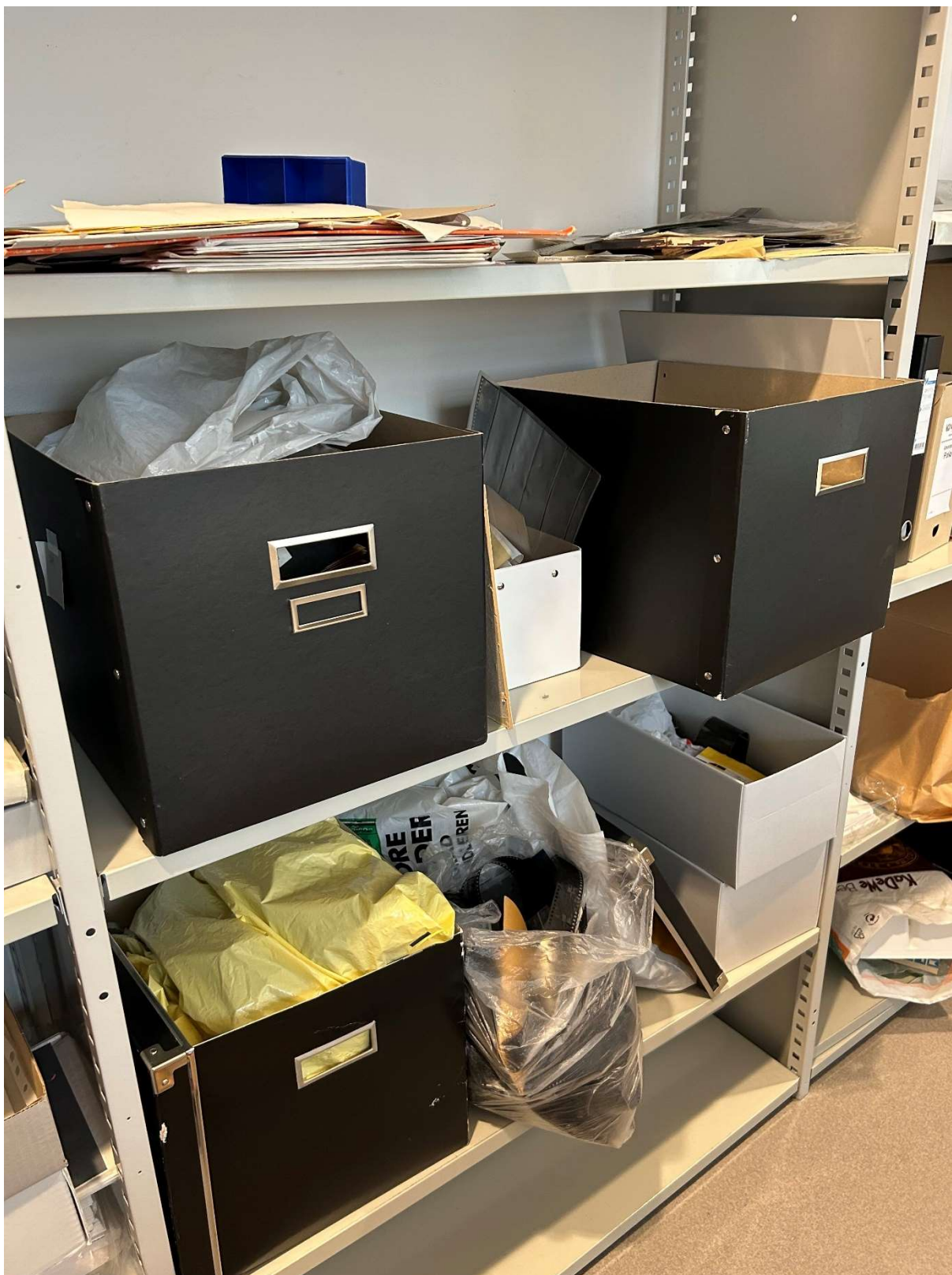
De fleste av eskene arkivet ankom i viste seg å inneholde ulike formater blandet sammen, hvilket gjorde grovsorteringsarbeidet mer utfordrende.